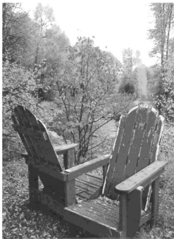
Si je pouvais passer une heure ici avec quelqu'un, j'aimerais que ce soit avec ...